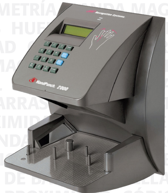
Biométricos de Mano