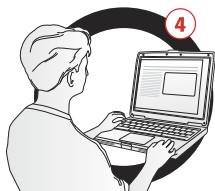
Definición de Reglas y Captura de Usuarios