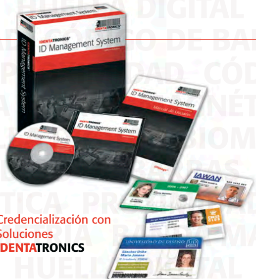
Credencialización con Soluciones IDENTATRONICS