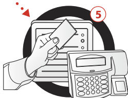
Presentación de Tarjeta al Lector, Lectura de huella, mano, etc...