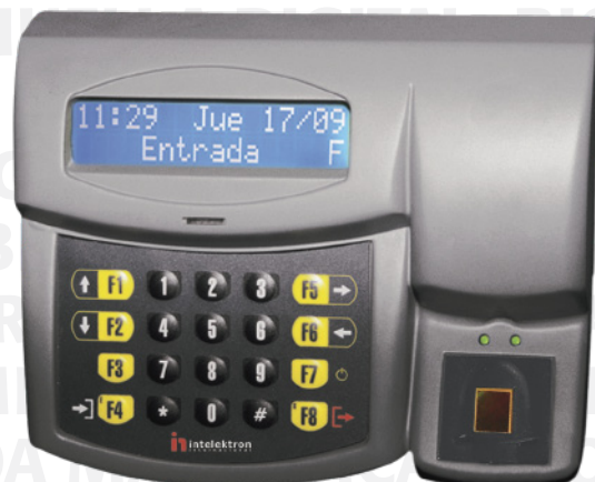
Relojes Electrónicos Inteligentes