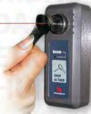
Memoria de Contacto