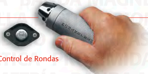
Control de Rondas