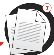
Elaboración de Reportes

IDENTATRONICS® Control de Acceso y Asistencia