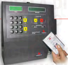
Reloj Electrónico Inteligente (Código de Barras, Banda Magnética, Proximidad)