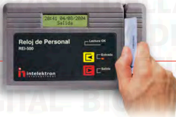
Reloj Electrónico Inteligente (Código de Barras, Banda Magnética, Proximidad)