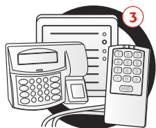
Conexión del Hardware y Cableado