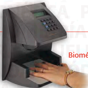
Biométrico de Mano